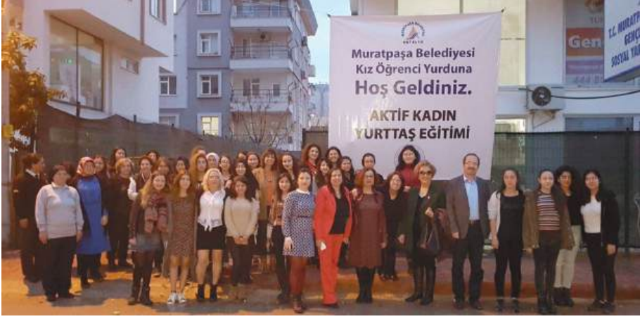
18.12.2017 – 12.02.2018 AKTİF KADIN YURTTAŞ EĞİTİMİ PROJESİ KONYAALTI CEMEVİ