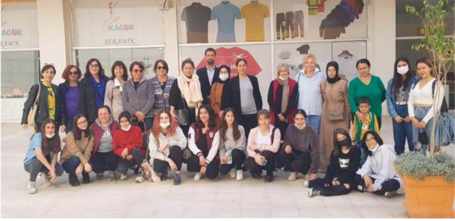
20 KASIM 2021 AİLEMLE GÜÇLÜYÜM SOSYAL ETKİNLİK HAYAT PARK