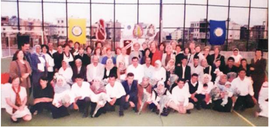
10 MAYIS 2001 OKUMA YAZMA KURSU SERTİFİKA TÖRENİ