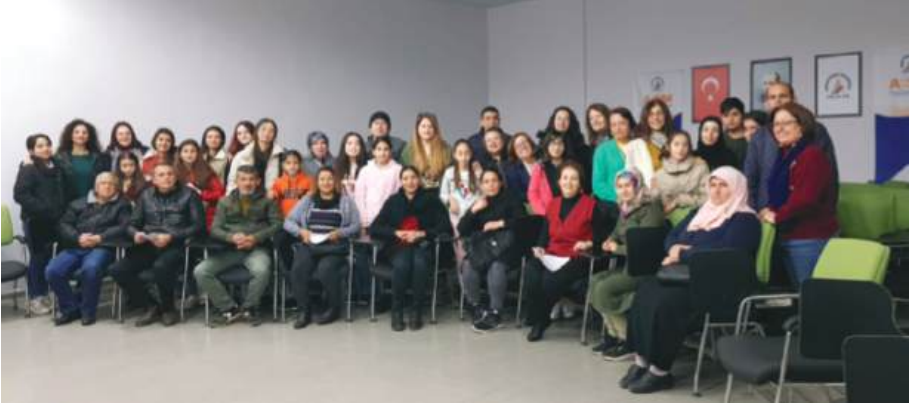
24 EKİM 2021 AİLEMLE GÜÇLÜYÜM 4.SEMİNER PROGRAMI