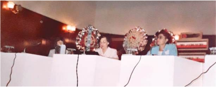
8 MART 1992 PROF. DR. TÜRKAN SAYLAN KONFERANSI