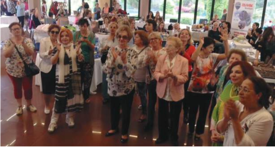
1 MAYIS 2019 KERMESİMİZ