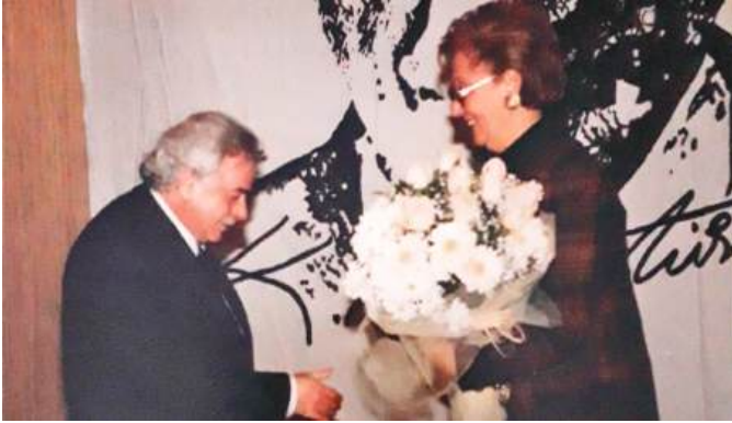
27.04. 2001 İLK TOPLU NİKAH TÖRENİ