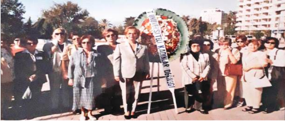
1997 AĞUSTOS STUTTGART BELEDİYE BAŞKANINI ZİYARET