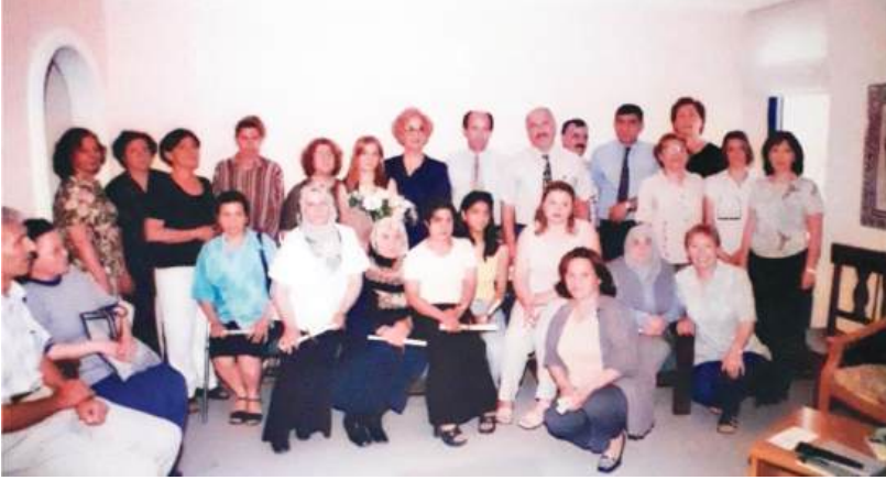
27 ARALIK 2001 OKUMA YAZMA KURSU SERTİFİKA TÖRENİ