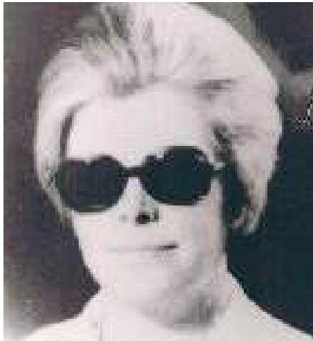
İstanbul Üniversitesi İstanbul Tıp Fakültesi İlk kadın patoloji öğretim üyesi