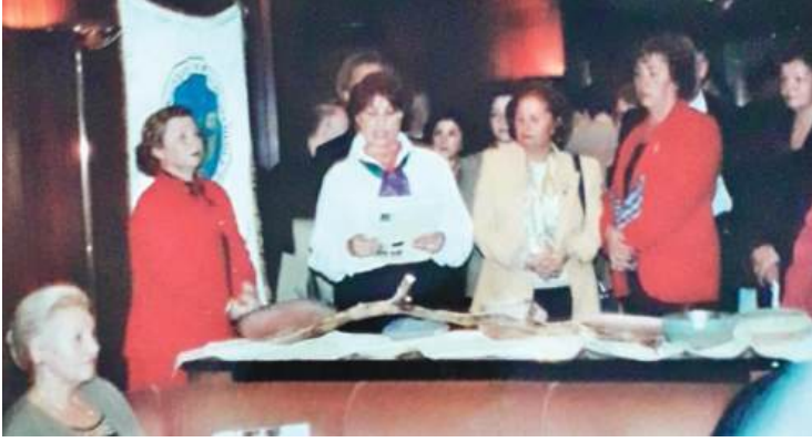
16.01.2001 PROF. DR. AHMET METE İŞIKARA KONFERANSI