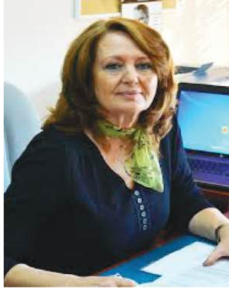
Düzenleyen FULYA SARVAN