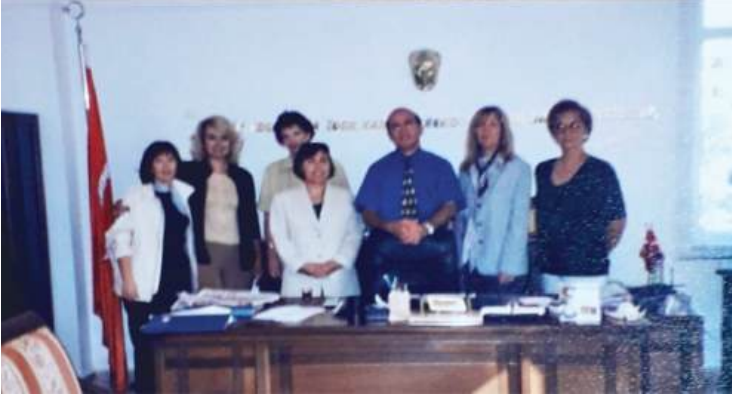
1997 AĞUSTOS STUTTGART BELEDİYE BAŞKANINI ZİYARET