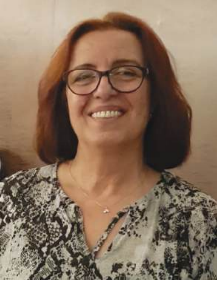
Derleyen AYNUR YOLCU