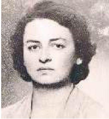
Hazine Avukatı Türk Hukukçu Kadınlar Derneği Kurucu Üyesi